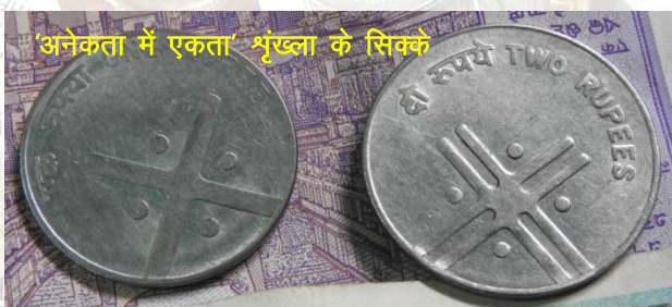
'अनेकता में एकता' श्रृंखला के सिक्के