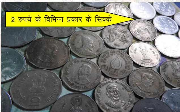
2 रुपये के विभिन्न प्रकार के सिक्के