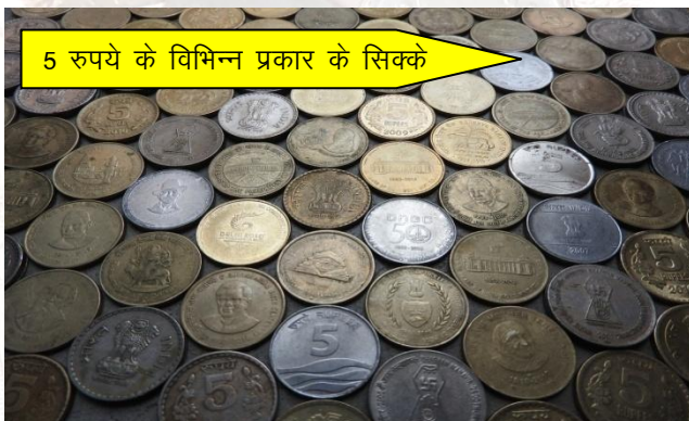
5 रुपये के विभिन्न प्रकार के सिक्के