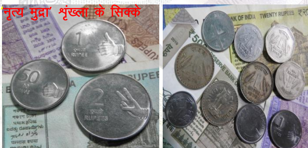
'नृत्य मुद्रा' श्रृंखला के सिक्के