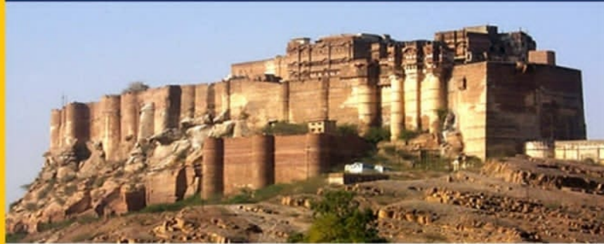
मेहरानगढ़ का किला