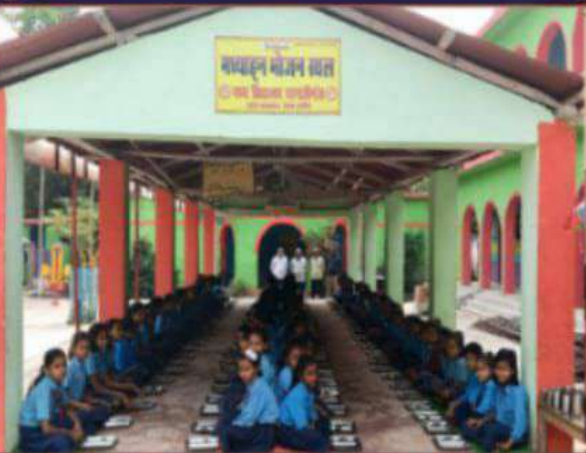
मध्य विद्यालय दरगाही गंज नरपतगंज अररिया