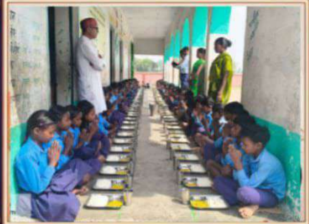
प्रा.वि. आदिवासी टोला मथुरा, तिरसकुंड, फॉरबिसगंज, अररिया।