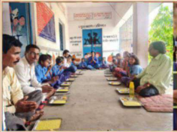
प्राथमिक विद्यालय अराप, बिक्रम, पटना।