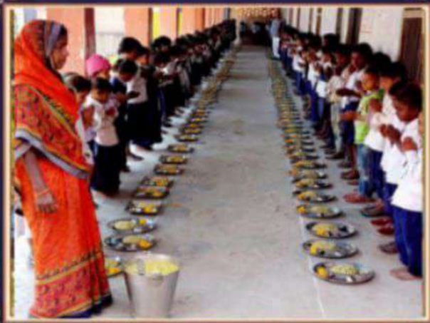
उत्क्रमित मध्य विद्यालय कैलाशपुर बेगूसराय