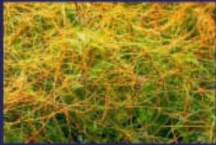
अमरबेल ( Cuscuta )