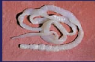
फीता कृमि (Tape Worm)