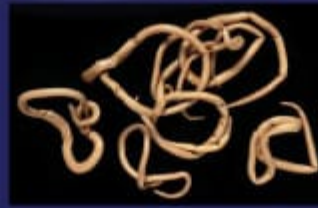
गोल कृमि ( Round Worm )