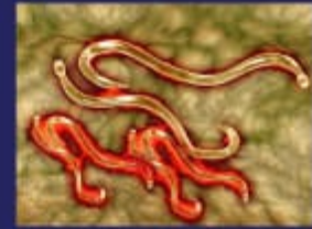
हुक वर्म ( Hook Worm )